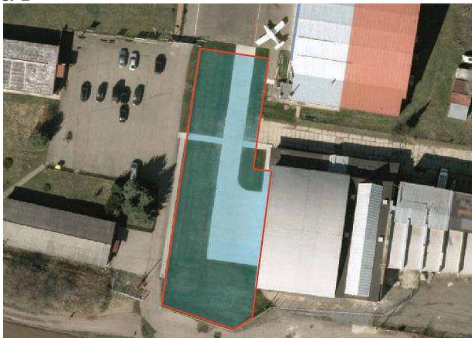
Obrázek 1 Manipulační prostor před hangárem 1.1 a)