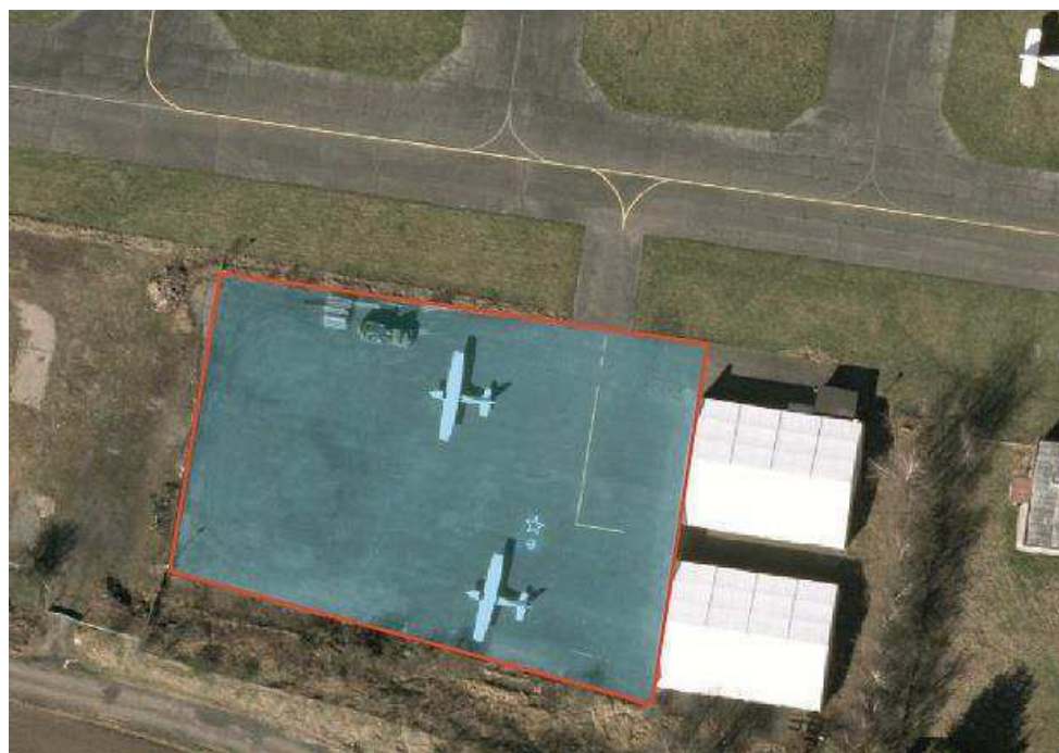
Obrázek 2 Manipulační prostor před hangárem 1.1 b)